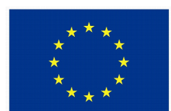
EUROPÄISCHE UNION Europäischer Sozialfonds